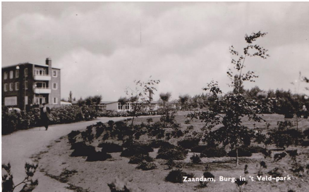
Bejaardenhuis Oostererf en verpleeghuis De Rozenboom

In dezelfde periode werd aan de Heijermansstraat aan de rand van het park een modern bejaardenhuis gebouwd met de naam Oostererf en een verpleeghuis voor bejaarden "De Rozenboom". Aan de overzijde van de straat verrees een nieuwe Gereformeerde kerk onder de naam Noorderkerk. De kerk speelde nog een grote rol bij de laatste vluchtelingenopvang.